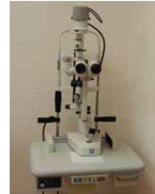
Oeil vu par une lampe à fente

Lampe à fente utilisée pour l'examen ophtalmologique